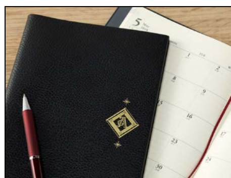
貼るだけでオリジナル手帳に。