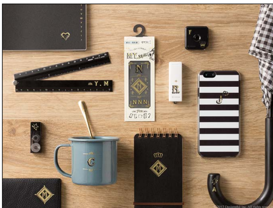
革・合成皮革、プラスチック、ガラスなど、硬いものにもこすって貼れる強粘着の立体転写シール『MY SEAL(マイシール)』新登場