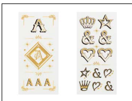
アルファベット「A 柄」～「Z 柄」(26 柄)、 「デコレーション柄」(1 柄)の全 27 柄