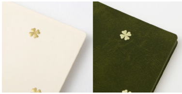
クローバー柄:白、緑