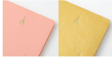
エッフェル塔柄:ピンク、金