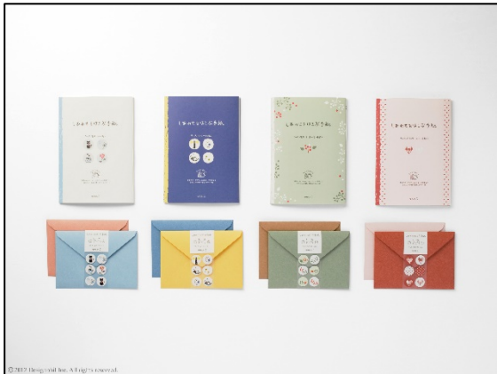
やわらかなイラストでラッキーモチーフをあしらった 『しあわせをはこぶ手紙』