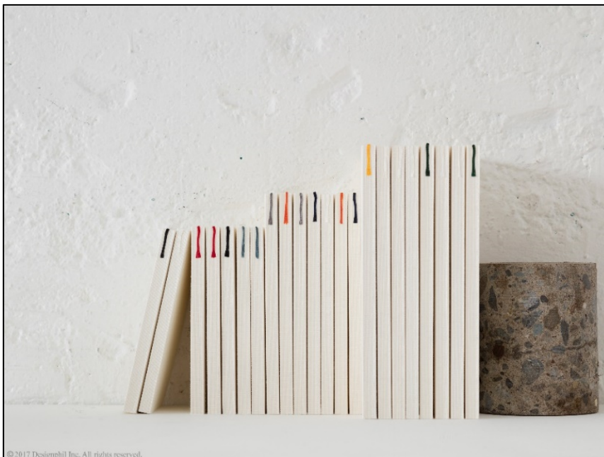
書く楽しさや心地よさを感じるアイテムを多数ご用意！ 「文具女子博 #インク沼」出展

「ミドリ」ブースでは、万年筆と相性が良い紙製品を中心に、書く楽しさや心地よさを感じられるアイテムを多数ご用意します。1960年代より自社開発している、筆記適正にこだわったオリジナル用紙「MD用紙」を使用した、書くことを愉しむためのプロダクトシリーズ MD PAPER PRODUCTS®からは、ひらめきを書き留める『MDノート』や、たっぷり書ける余白が魅力の『MDノートダイアリー』などを展開。「MD用紙」に自由に試し書きができるスペースを設け、その場で書き心地を体感いただけます。また、お気に入りの万年筆で大切な人への気持ちを綴るアイテムとして、やわらかなイラストでラッキーモチーフをあしらった『しあわせをはこぶ手紙』や、文字をきれいに書ける秘密の下敷きが付いた『きれいな手紙が万年筆で書ける便箋』などをご用意。さらに、日々を記すアイテムとして、過去を振り返りながら今日の出来事を綴る『連用日記 扉』や、休日にゆっくりと1週間の出来事をまとめられる『きゅうじつ日記』などをご紹介します。さらに、ご来場のうれしい特典として、「MD PAPER PRODUCTS」の製品をご購入のお客さまに、イベント限定オリジナルデザインのインク吸い取り紙(ビュバー)を数量限定でプレゼントします。