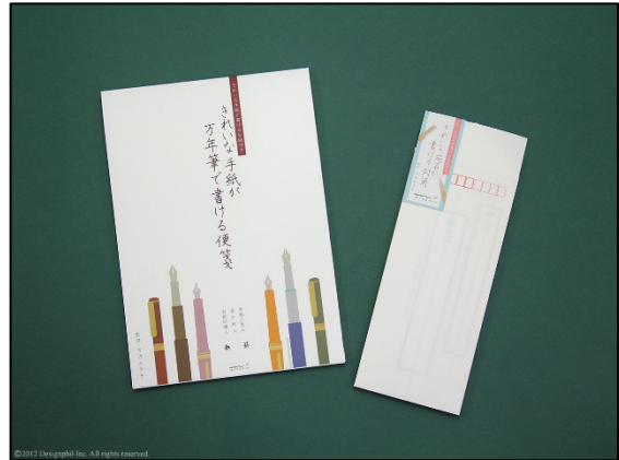
文字をきれいに書ける秘密の下敷きが付いた 『きれいな手紙が万年筆で書ける便箋』