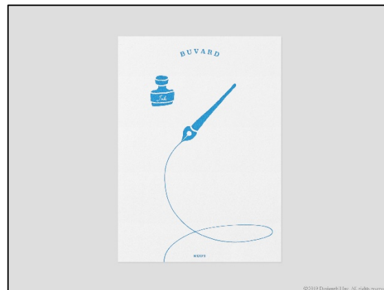
「MD PAPER PRODUCTS」をご購入のお客さまに、イベント限定のインク吸い取り紙(ビュバー)をプレゼント! ※数量限定