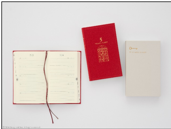
過去を振り返りながら今日の出来事を綴る 『連用日記 扉』