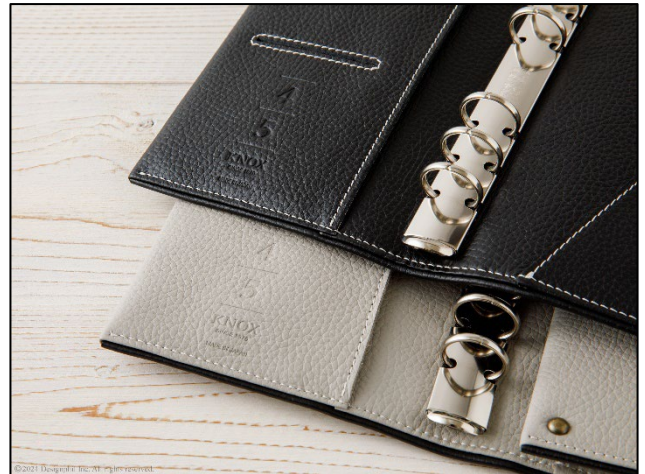
左側ポケット下には、空押しで45周年のロゴ入り