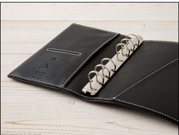
たっぷり入る20mmの太径リング