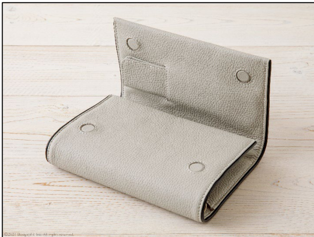
片手でもワンタッチで開閉できるマグネットホック