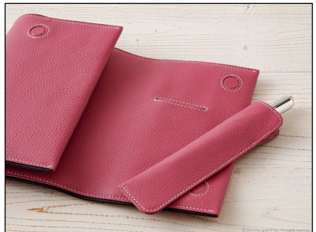
ペンポケットに刺せるオリジナルペンシース付き