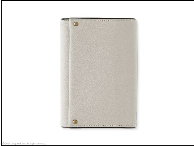
風呂敷をモチーフにしたデザイン