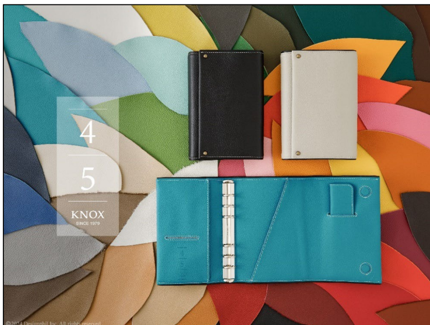
「KNOX」45周年を記念した、日本の美しい45色のシステム手帳 「包み込む」数量限定発売